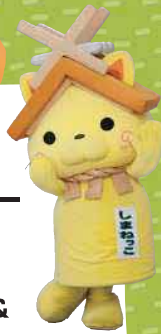
島根県観光キャラクター「しまねっこ」 登録商標第7194号