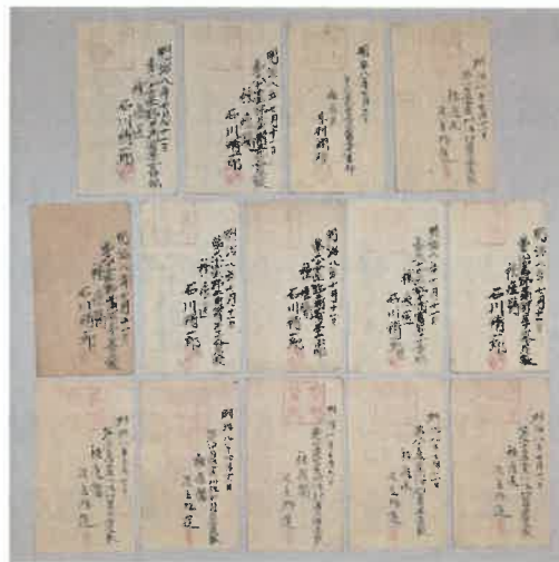
同年7月11日の種痘証 14枚