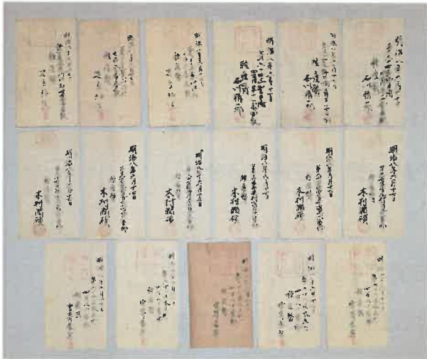
明治8年6月17日の種痘証 17枚