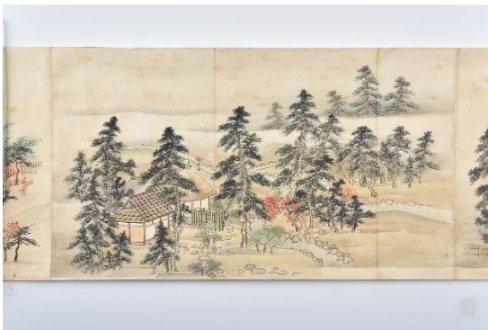
伝谷文晁筆≪雲州侯大崎別業真景図巻≫