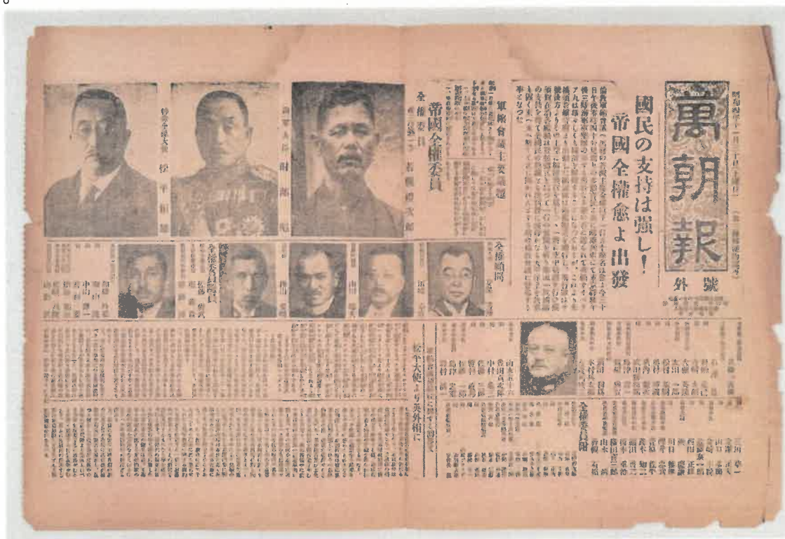
よるぢちやうほう 『萬朝報』号外 (昭和4年11月30日付)

この度の展示では、ロンドン海軍軍縮会議の際に使用した道具や撮影した写真など、若槻家旧蔵の資料を紹介します。