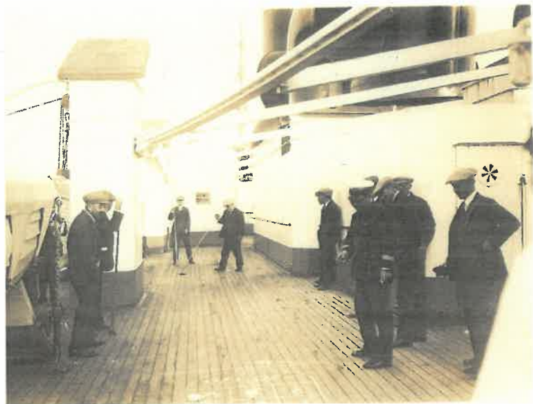
写真「デッキビリヤードに興じる使節団」