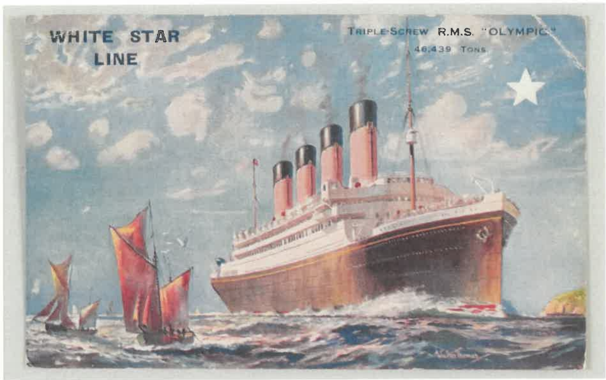
使節団が乗船したオリンピック号（ニューヨーク～サウサンプトン）【裏面】