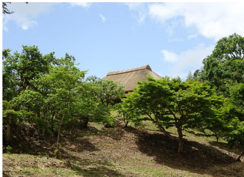
追加指定地から望む重要文化財菅田庵及び向月亭