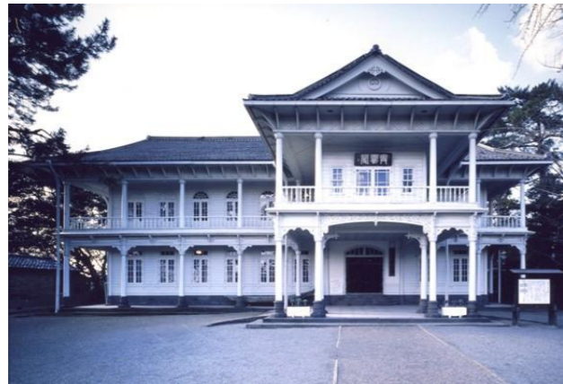
島根県指定有形文化財「興雲閣(こううんかく)」