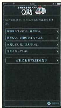
視覚効果 「明度反転」