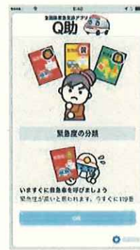
緊急度の分類説明