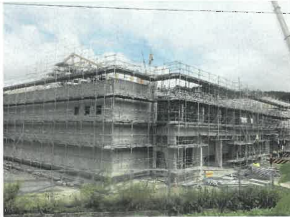
屋内運動場北面より現場全景撮影 R2.8.31 撮影