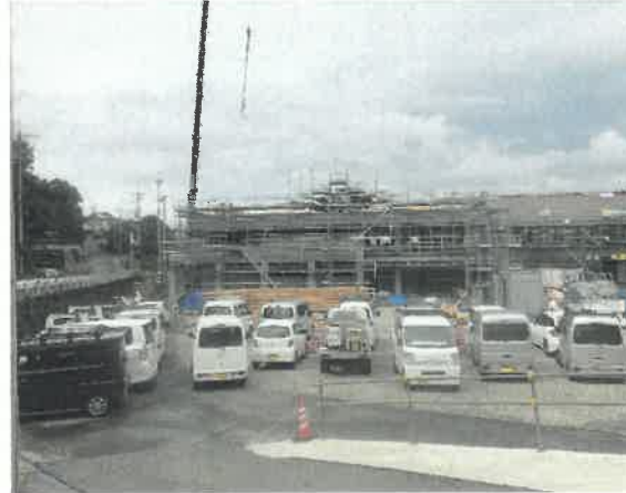
屋内運動場南面より現場全景撮影 R2.8.31 撮影