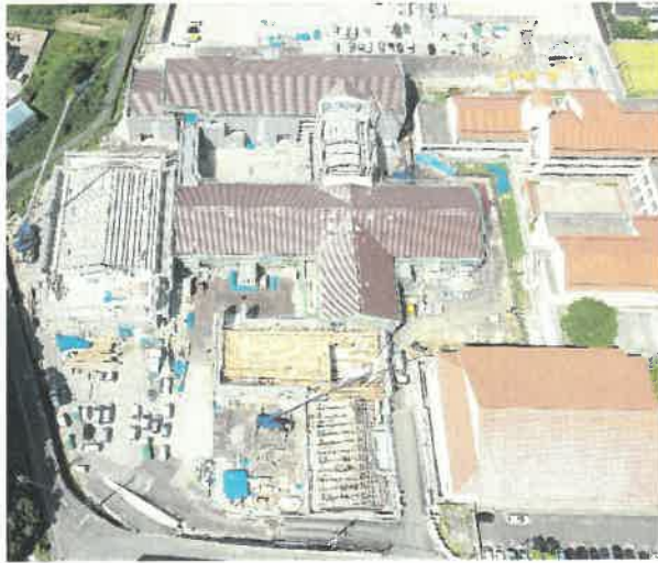
上空より現場全景撮影 R2.8.31 撮影