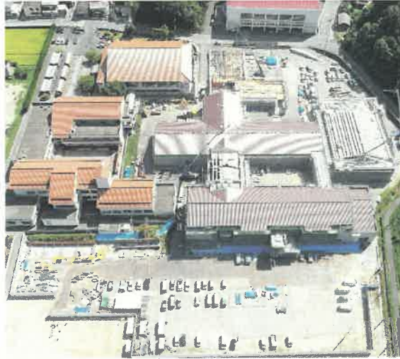
上空より現場全景撮影 R2.8.31 撮影