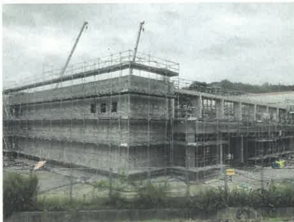
屋内運動場北面より現場全景撮影 R2.7.31 撮影