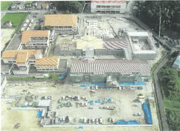
上空より現場全景撮影 R2.7.31 撮影