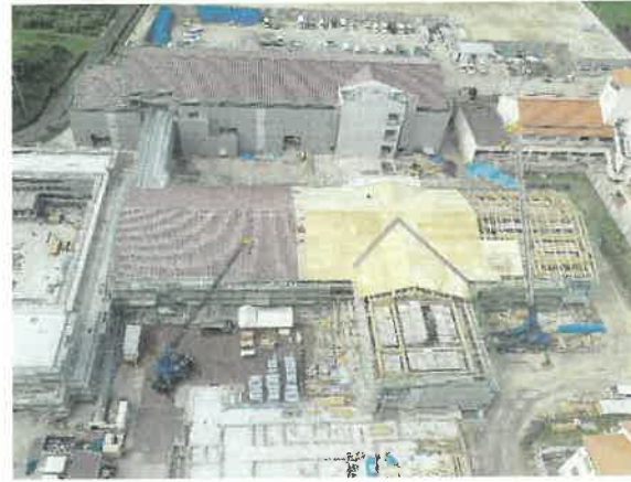
上空より現場全景撮影 R2.7.31 撮影