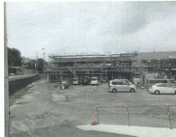
屋内運動場南面より現場全景撮影 R2.7.31 撮影