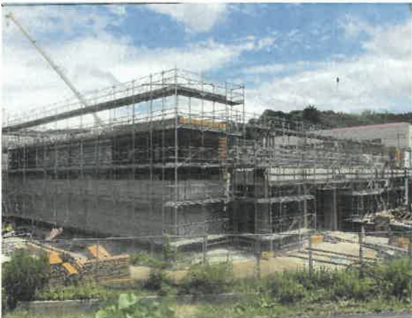
屋内運動場北面より現場全景撮影 R2.6.30 撮影