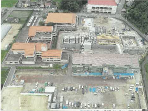
上空より現場全景撮影