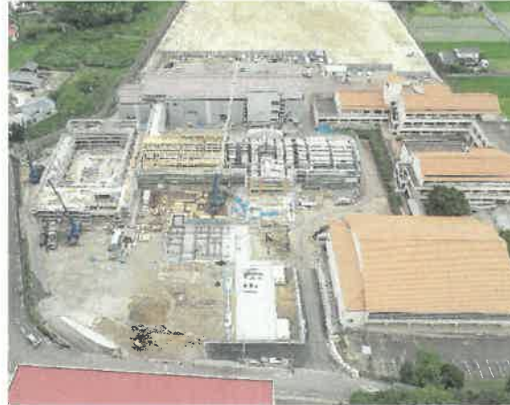
上空より現場全景撮影