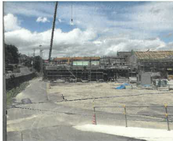
屋内運動場南面より現場全景撮影 R2.6.30 撮影