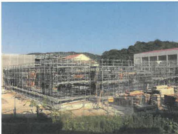
屋内運動場北面より現場全景撮影 R2.5.30 撮影