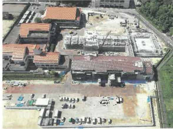
上空より現場全景撮影 R2.5.28 撮影