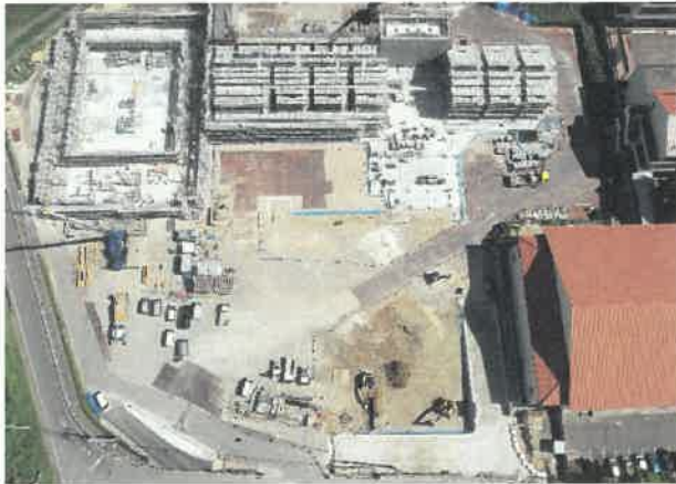
上空より現場全景撮影 R2.5.28 撮影