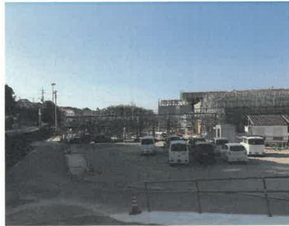
屋内運動場南面より現場全景撮影 R2.5.30 撮影