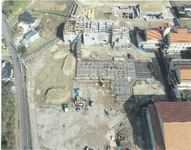
上空より現場全景撮影 R2.2.26 撮影