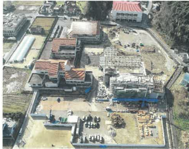
上空より現場全景撮影 R2.2.26 撮影