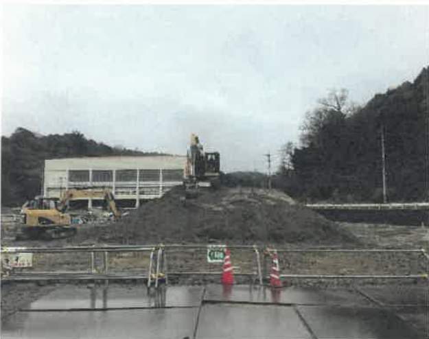
屋内運動場北面より現場全景撮影 R2.2.29 撮影