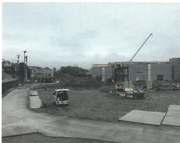
屋内運動場南面より現場全景撮影 R2.2.29 撮影