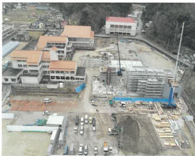
上空より現場全景撮影