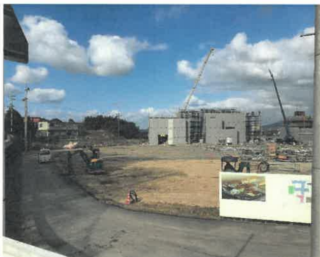
屋内運動場南面より現場全景撮影 R2.1.31 撮影