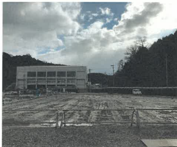
屋内運動場北面より現場全景撮影 R2.1.31 撮影