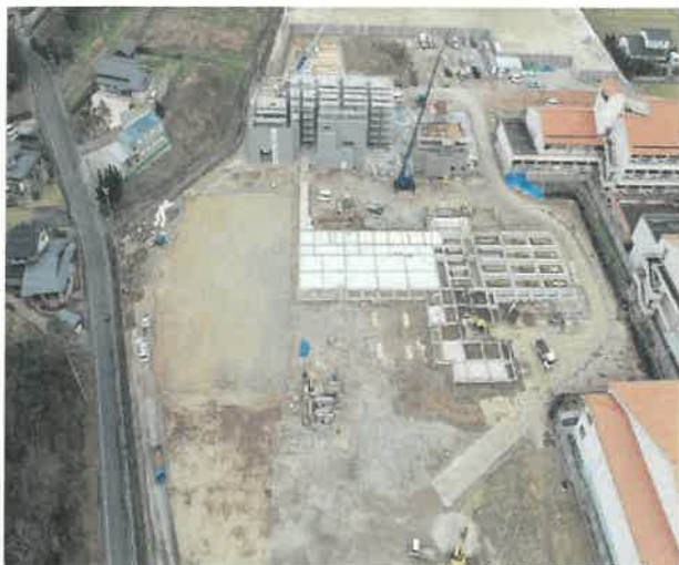
上空より現場全景撮影