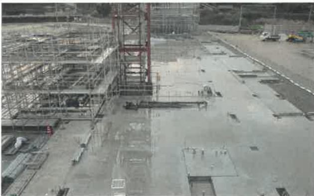
東方向より撮影 (校舎 A 棟)