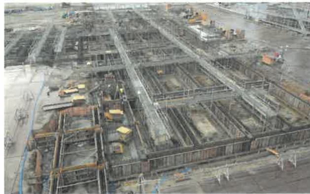
東方向より撮影 (校舎 F 棟)