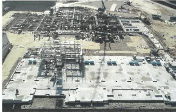
上空より現場全景撮影