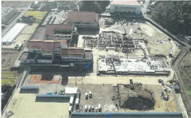
上空より現場全景撮影