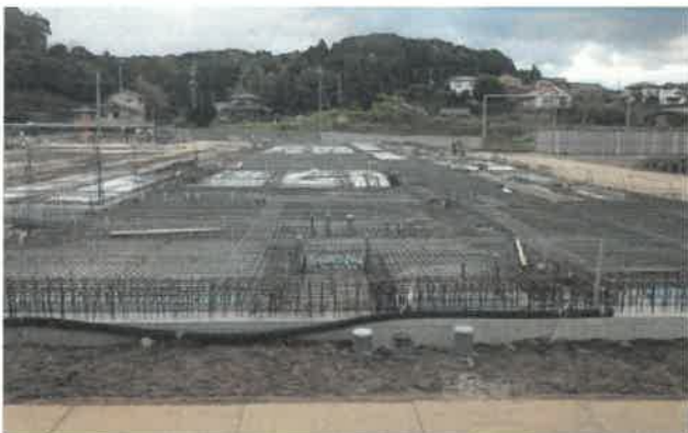
東方向より撮影 (校舎 A 棟)