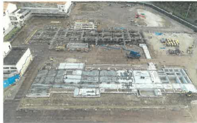
上空より現場全景撮影