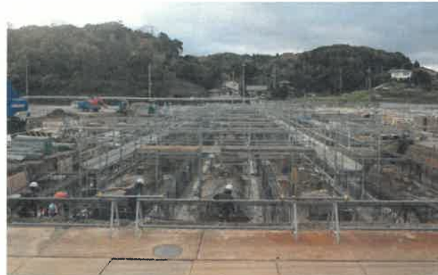
東方向より撮影 (校舎 F 棟)