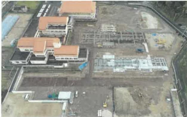
上空より現場全景撮影