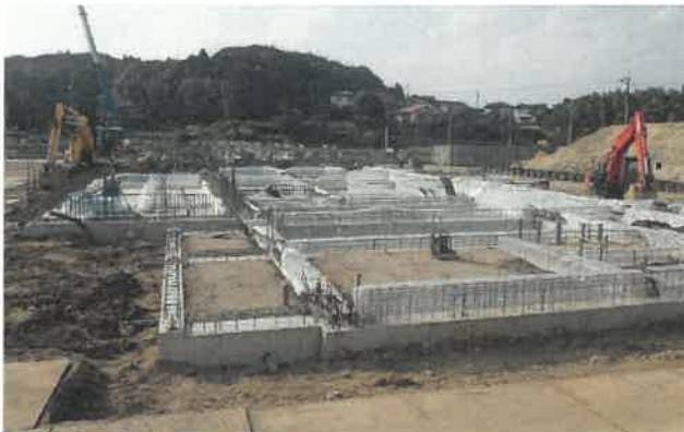
東方向より撮影 (校舎 A 棟)