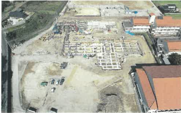
上空より現場全景撮影