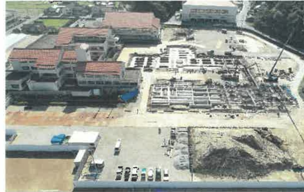
上空より現場全景撮影