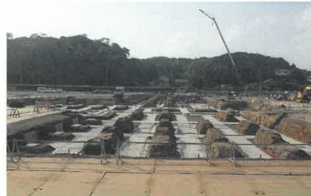
東方向より撮影 (校舎 F 棟)