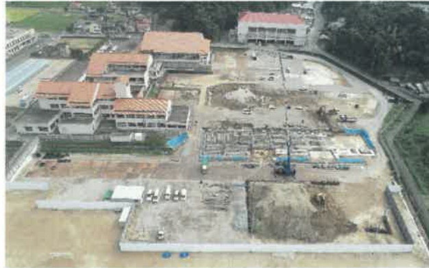
上空より現場全景撮影