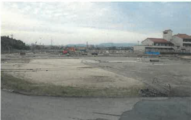
南方向より現場全景撮影