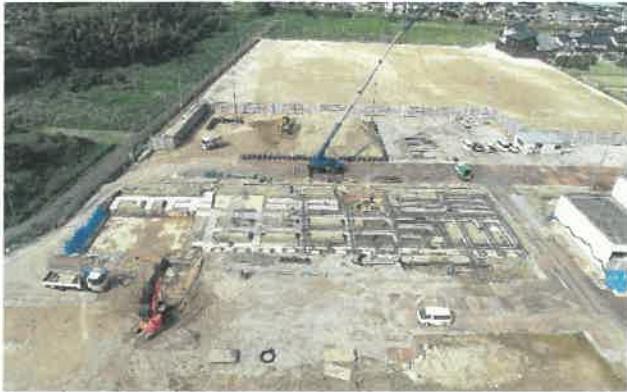
上空より現場全景撮影