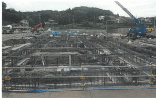
東方向より撮影（校舎 A 棟）