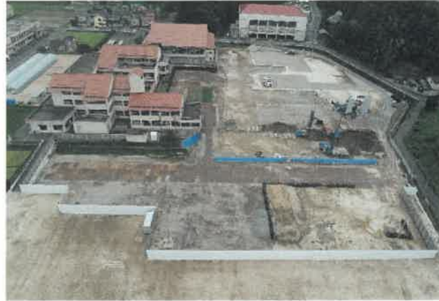
上空より現場全景撮影