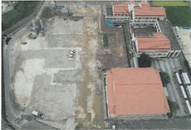
上空より現場全景撮影