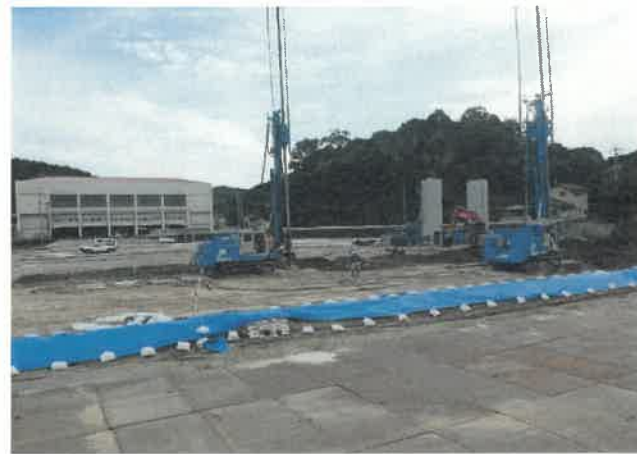
北方向より撮影（校舎 A 棟）