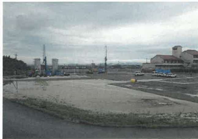
南方向より現場全景撮影