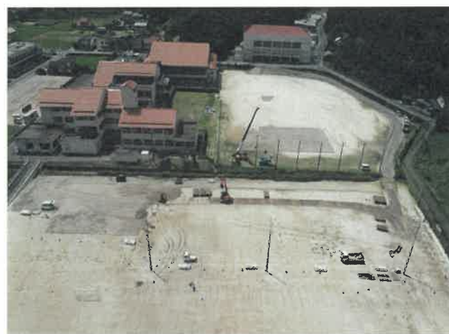
上空より現場全景撮影