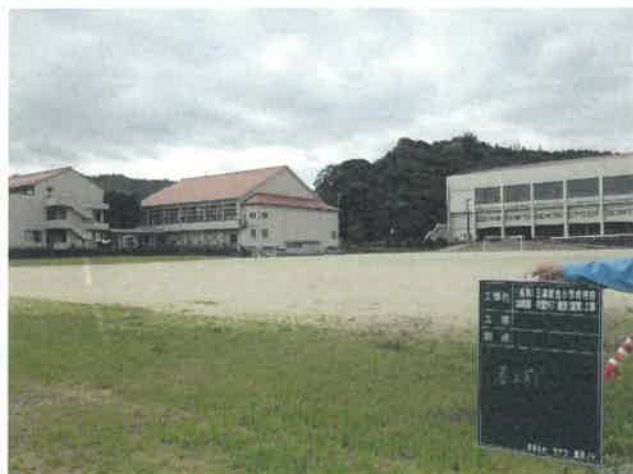
北方向より現場全景撮影