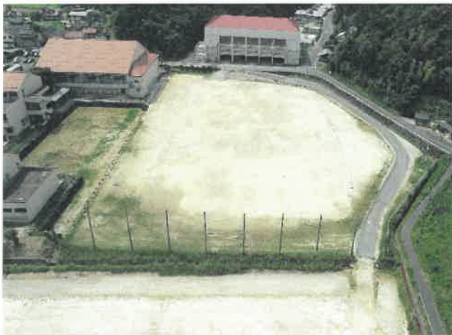
上空より現場全景撮影