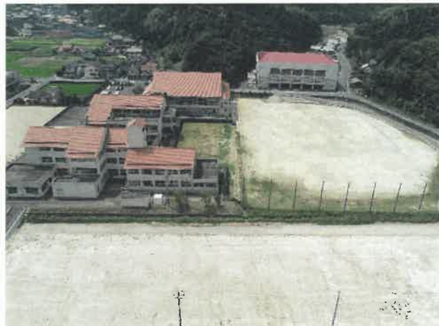
上空より現場全景撮影