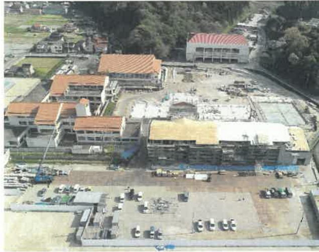
上空より現場全景撮影