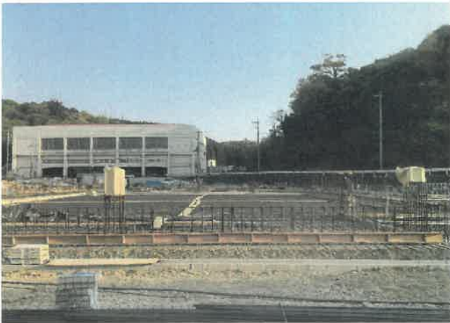
屋内運動場北面より現場全景撮影 R2.4.29 撮影