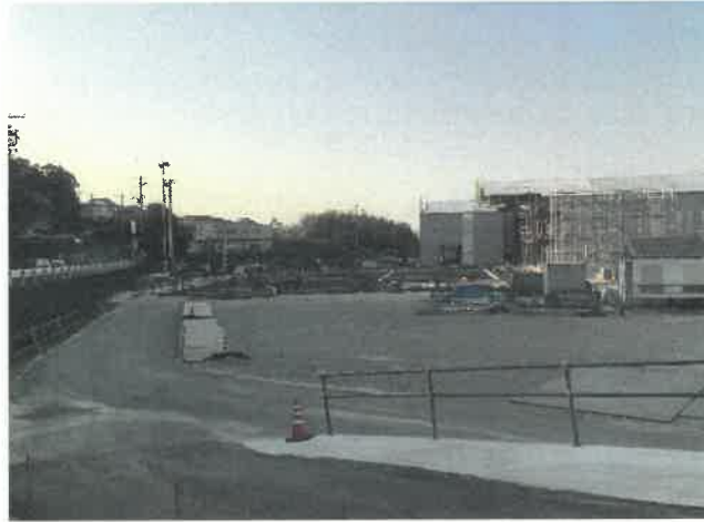
屋内運動場南面より現場全景撮影 R2.4.29 撮影