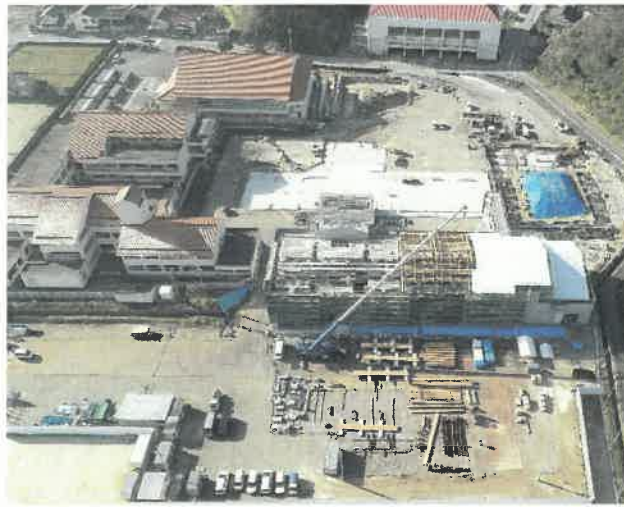
上空より現場全景撮影