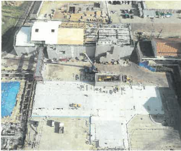
上空より現場全景撮影