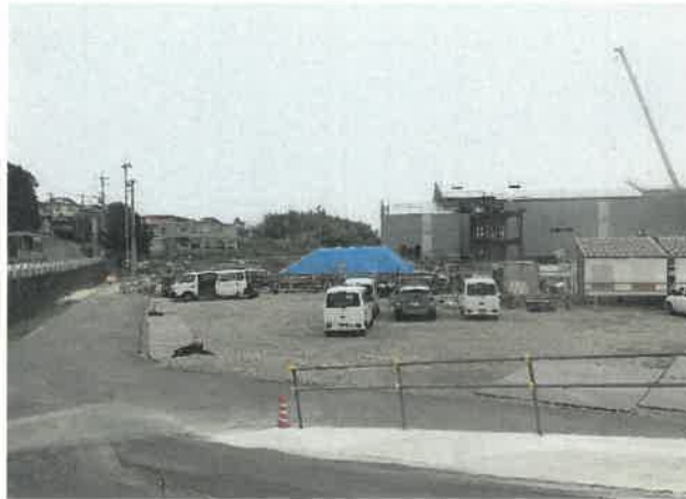
屋内運動場南面より現場全景撮影 R2.3.31 撮影