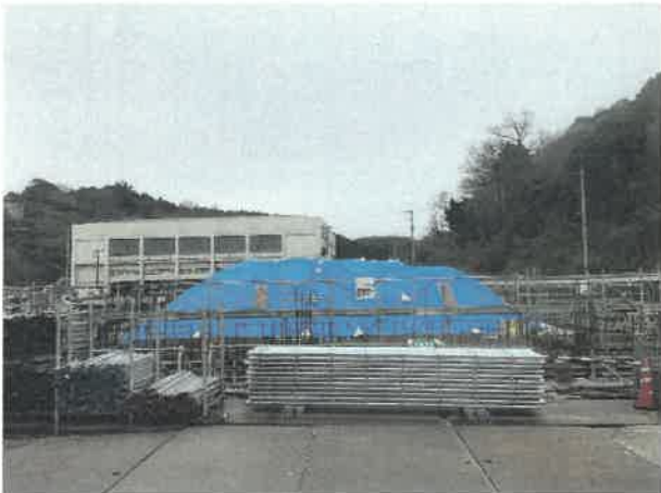
屋内運動場北面より現場全景撮影 R2.3.31 撮影