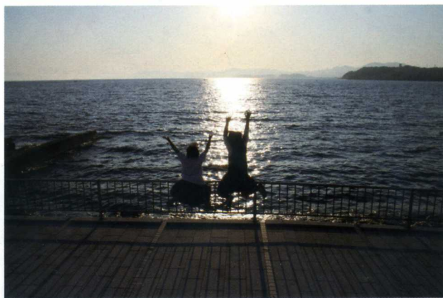
第6回「水の都・松江」フォトコンテスト 高校生の部最優秀作品賞 「青春」