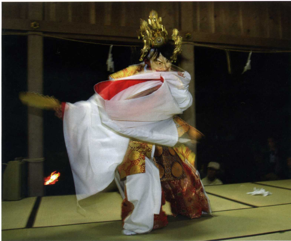
第6回「水の都・松江」フォトコンテスト 最優秀作品賞 「古事伝承」